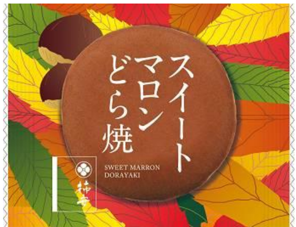
パッケージデザインも秋仕様で登場