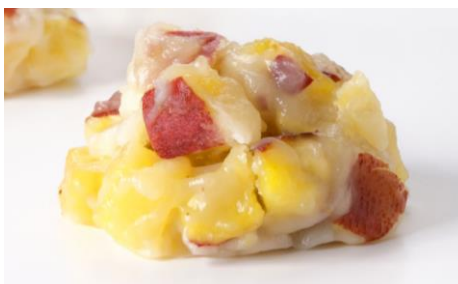
「鬼まんじゅう」(税込 180 円)

角切りのさつま芋を加えて蒸したまんじゅう。鬼の金棒に似た見た目と素朴な味の和菓子として、中部日本の秋の定番和菓子です。徳島県産鳴門金時芋を 100% 使用し、素材のおいしさを引き立たせています。また、栗をのせた「栗鬼まんじゅう」も順次ご用意しています。