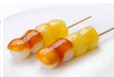
「よくばり団子 (みたらし・栗あん)」(税込 160 円)