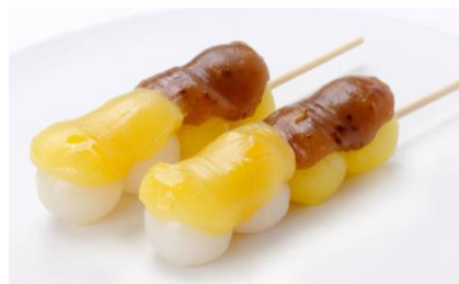
「よくばり栗きんとん団子 (栗あん・渋栗あん)」(税込 180 円)

一串で 2 種類の味を楽しめるその名の通りよくばりなお団子。2 種類の栗餡の違いを楽しめる「よくばり栗きんとん団子 (栗あん・渋栗あん)」と定番のみたらしと栗の風味を楽しめる「よくばり団子 (みたらし・栗あん)」の 2 種類をご提供します。