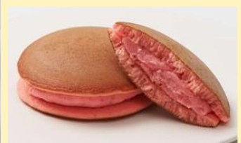
「いちごミルクどら焼」