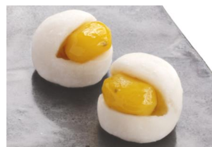
「栗きんとん大福」(税込 230 円)

柔らかい餅と栗餡の絶妙なハーモニーが味わえる一品。1 粒の栗をまるごと入れた贅沢な「栗きんとん大福」をお作りしました。