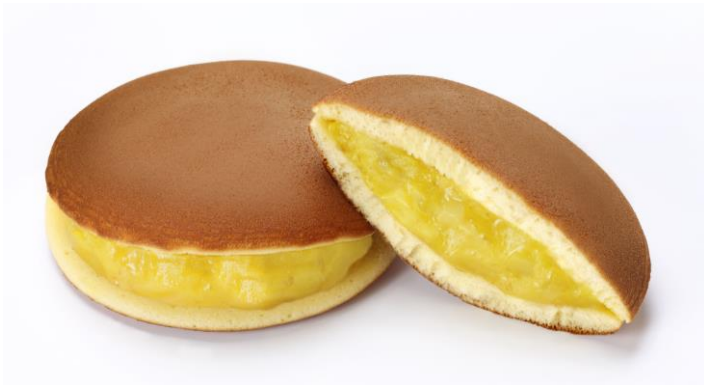
「スイートマロンどら焼」（税込230円）

おいしさをブラッシュアップした今年は、販売目標を15万個とし、全国約150店舗の「口福堂」「柿次郎」で販売します。