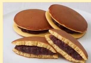
定番人気商品の「どら焼」