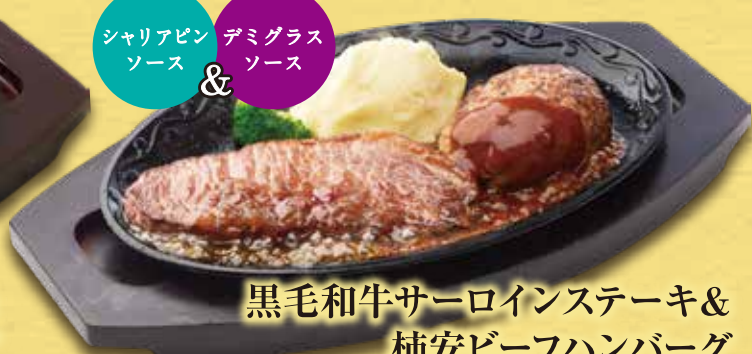
黒毛和牛サーロインステーキ & 柿安ビーフハンバーグ