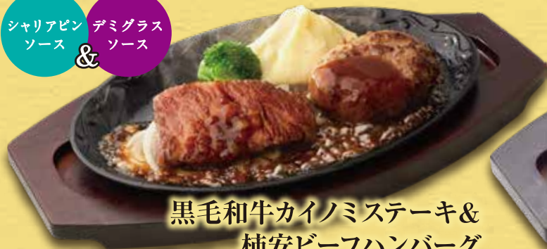
黒毛和牛カイノミステーキ & 柿安ビーフハンバーグ