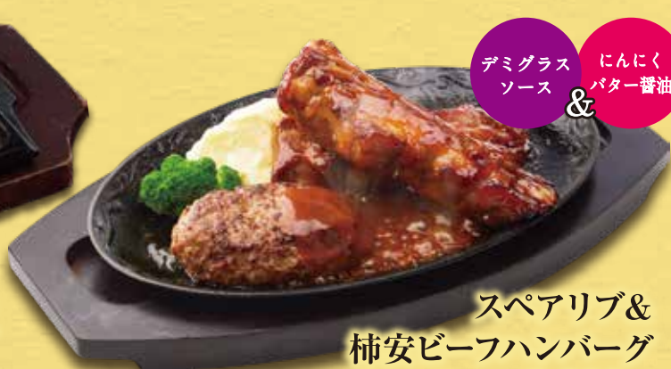
スペアリブ & 柿安ビーフハンバーグ