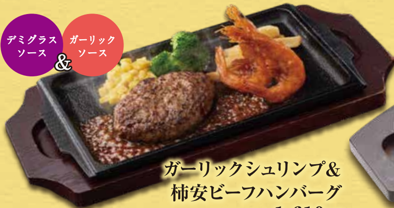
ガーリックシュリンプ & 柿安ビーフハンバーグ